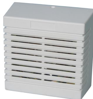
Siren 402 med DS-3

DS-3 levereras som standard i kapslingen för siren 402 .